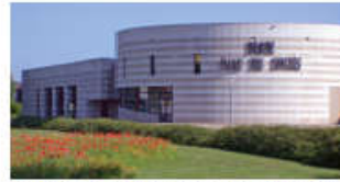
Palais des Congrès de BEAUNE