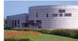
Palais des Congrès de BEAUNE